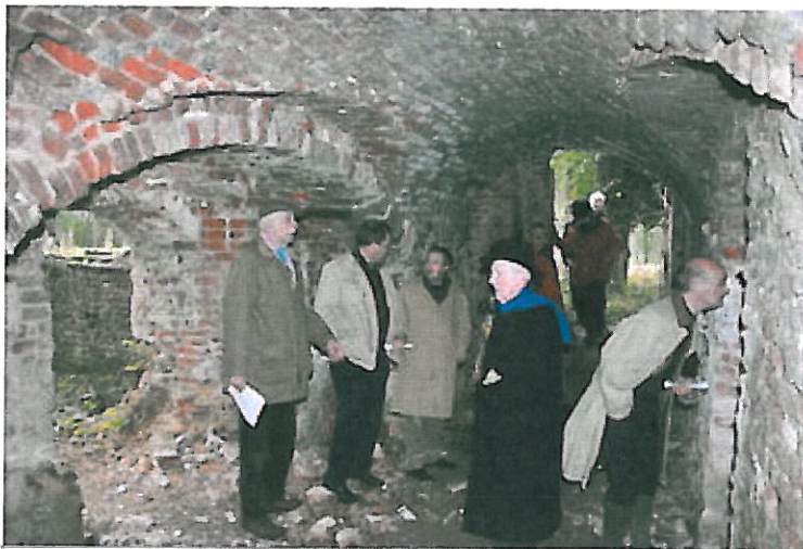
Er werd ook een bezoek gebracht aan de kelders onder de kasteelruïne.