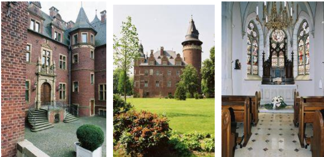
Kasteel Krickenbeck: entree, aanzicht vanuit park en kapel

Het kasteel werd in de achttiende en negentiende eeuw nog op onderdelen aangepast aan de mode van die tijd. Zo vond er in de jaren 1856-60 een verbouwing plaats die het kasteel een neo-gotisch aanzicht zou geven. Een generatie later wordt het kasteel verbouwt tot neo-rennaissance kasteel. Aanleiding was de brand van 1902 waardoor nieuwbouw noodzakelijk was. Architect werd Hermann Schaedtler en hij opent de viervleugelige burcht en maakte her representatiever.