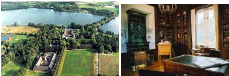
Luchtfoto en interieuroopname van de bibliotheek van kasteel Krickenbeck

Schloß Krickenbeck ontstond in het midden van de dertiende eeuw als een belangrijke waterburcht. In 1904 werd het kasteel na een brand herbouwd op de fundamenten van een Neo-Renaissance aanleg uit de zeventiende eeuw. Eind jaren 1980 werd het kasteel gerestaureerd en in gebruik genomen als trainingscentrum voor de WestLandesbank. Het complex bestaat verder uit een voorburcht eveneens met drie vleugels en een toren uit 1695. In 1673 ging het kasteel over in handen van de graven Von Schaesberg. De bouwgeschiedenis van het kasteel wordt gekenmerkt door opbouw, verwoesting en wederopbouw.