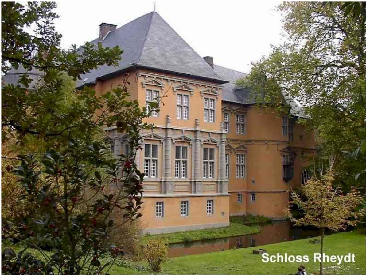
Kasteel Rheydt gezien vanaf een aarden wal

Het slot Rheydt is het best behouden Renaissance-kasteel in het Nederrijngebied en vanuit die optiek een van de belangrijkste monumenten van Monchenglodbach.