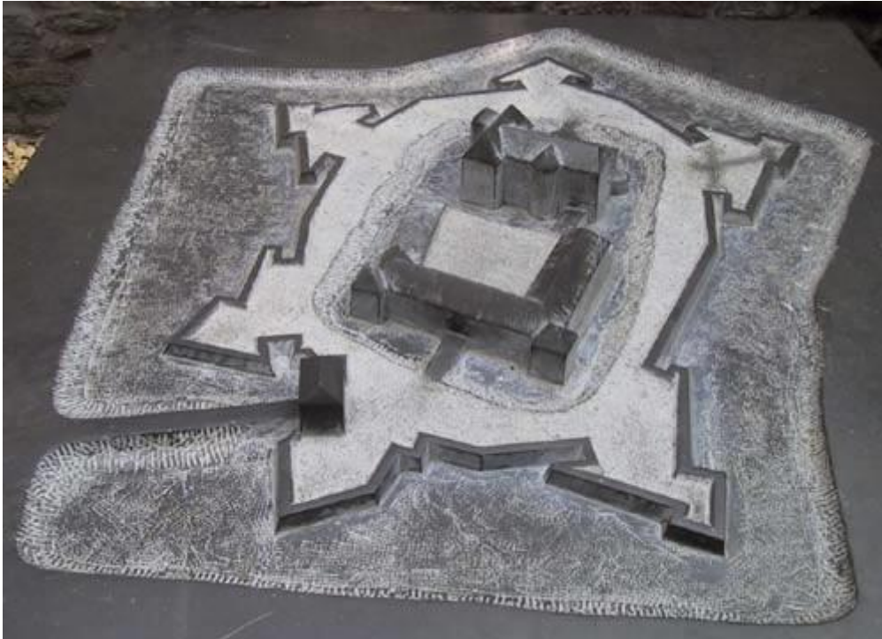
Een maquette van kasteel Rheydt, rond 1600

Het kasteel kende een essentiële veranderingsfase in zestiende eeuw onder Otto van Bylandt (rond 1525 - 1591), die waarschijnlijk werd ontworpen door bouwmeester Maximilian Pasqualini (1534 - 1572) die ook in Julich actief was. Otto van Bylandt liet het manor-huis representatief gebouw ontwikkelen. In de nieuwe opvattingen kon dat ook omdat het huis werd omringd door bastions die het vuurgeschut op afstand moesten houden. Die nieuwe inzichten zien we in Rheydt zeer mooi geïllustreerd terug.