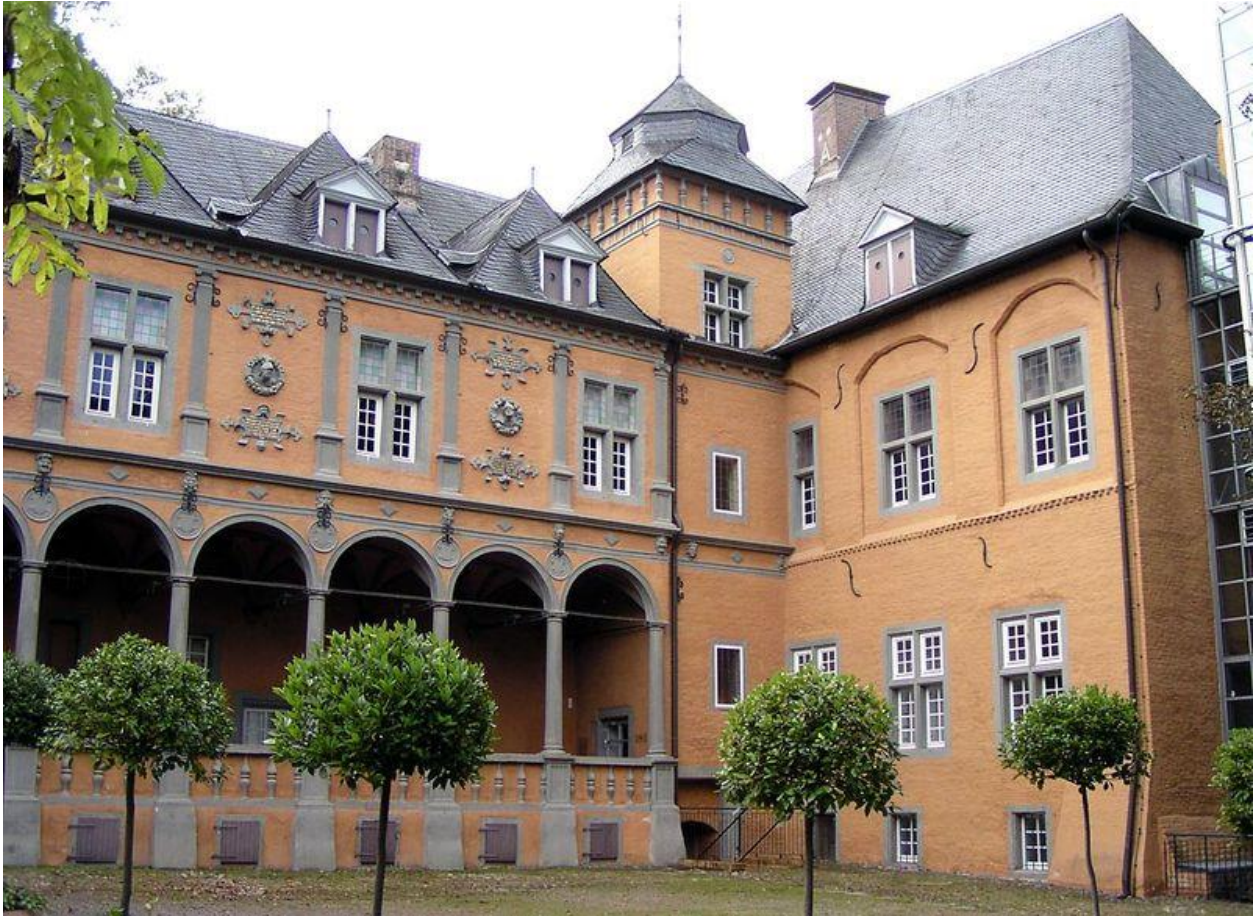
De loggia van schloss Rheydt