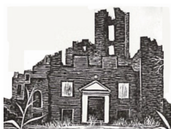
Stichting Kasteelruïne Bleijenbeek

HUIS VOOR DE KUNSTEN LIMBURG / STICHTING LIMBURGSE KASTELEN